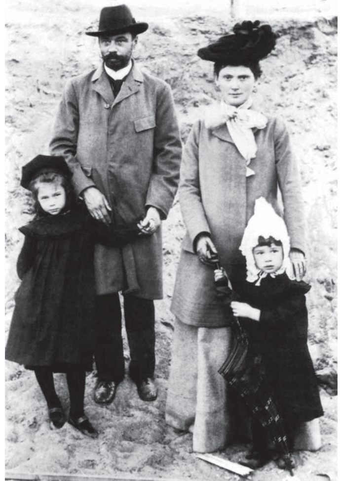
Die Familie stand im Zentrum einer Tagung über Biographien.