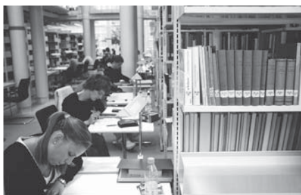
Die wichtigen und beliebten Lernorte für Studierende, die rund 50 Bibliotheken der Universität, werden mit der StUB zur «Universitätsbibliothek» vereint.

stelle für das breite Publikum und hat den derzeit grössten und alle Wissensgebiete umfassenden Medienbestand. Sowohl der Standort an der Münster-gasse als auch das Angebot und der Service der ehemaligen StUB bleiben für die Benutzerinnen und Benutzer gleich. Geplant ist eine Zusammenarbeit mit der Burgergemeinde Bern bei den historischen Beständen. Die grossen und wertvollen Sondersammlungen, die alten Drucke der StUB und das Restaurierungsatelier sollen voraussichtlich ab 2008 in einer Abteilung «Zentrum Historische Bestände» zusammengefasst werden. Damit könnten die Dienstleistungen in diesem Bereich ausgebaut (z. B. Speziallesesaal, erweiterter Reproduktionsservice) sowie die wissenschaftliche Forschung und die Zusammenarbeit mit andern Institutionen, namentlich der Burgerbibliothek Bern, gefördert werden. Gleichzeitig wäre das «Zentrum Historische Bestände» für die Beratung und Betreuung der Sondersammlungen und älteren Bestände der gesamten Universitätsbibliothek verantwortlich.