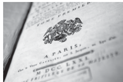
Bei den wertvollen historischen Büchern und Karten und dem Atelier zu ihrer Restaurierung wollen StUB und Burgergemeinde zusammenarbeiten.