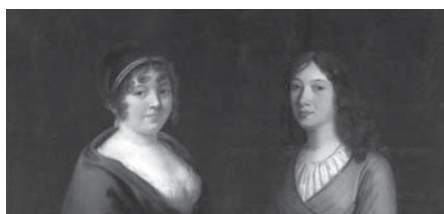
Friedrich Schiller mit den beiden wichtigsten Frauen in seinem Leben: Ehefrau Charlotte und Schwägerin Caroline.