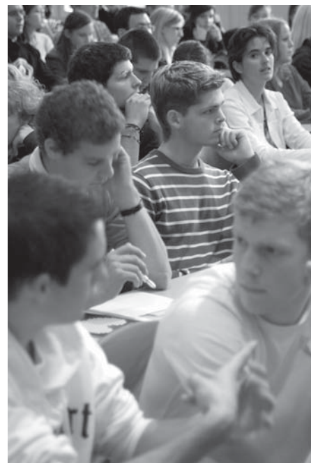
Skeptische, neugierige, aufmerksame und immer wieder fragende Blicke: die Erstsemestrigen.