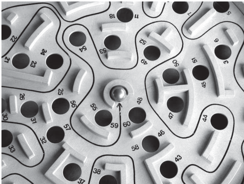
Der «Umweg» über das BNF kann sich lohnen. Zwei von drei Naturwissenschaftlern finden nachher eine Stelle.

Hoch qualifiziert im biomedizinischen oder naturwissenschaftlichen Bereich und arbeitslos: was nun? Ein spezielles Angebot hilft weiter und fördert die berufliche Integration von stellensuchenden Akademikern und Akademikerinnen – mit Erfolg und das seit zehn Jahren.