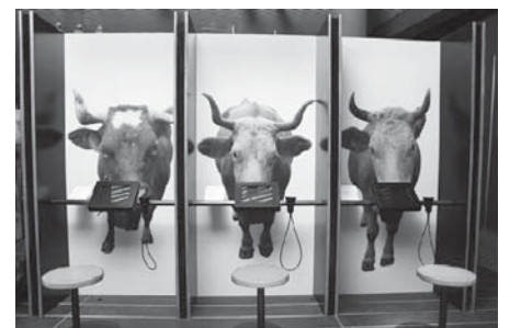
Kuhleben in der Ausstellung: zwischen Milch-Hochleistung, künstlicher Befruchtung und Kukkämpfen.

Informationen über die speziellen Öffnungszeiten und die Ausstellung unter: www.mfk.ch oder www.nmbe.ch .