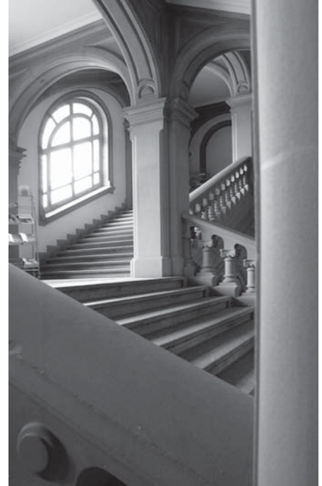
Das Qualitätsjahr hat begonnen. Ob auf Stufe eins, zwei oder drei – das Verständnis für eine Qualitätskultur an der Uni Bern