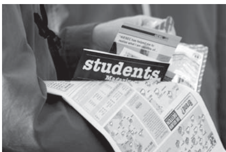
Überall gabs Broschüren und Infomaterial: Findet man damit den Weg zum Studium?

Freitag, 20. Oktober, neun Uhr früh, Uni Hauptgebäude: Die Aula ist voll besetzt, die letzten Ankömmlinge müssen sich mit einem Stehplatz begnügen. Die Erstsemestrigen warten gespannt auf die Begrüssung von Rektor Urs Würigler. «Die Uni Bern verlangt einiges von ihren Studierenden», sagt dieser, «aber der Anfang wird nicht schwierig sein, wir helfen Ihnen.» Würigler verwies auf die Studienberatung, die mit Rat und Tat zur Seite steht, und ermutigte die Studierenden, sich nicht vom Bologna-Modell abschrecken zu lassen: «Trotz strukturiertem Studienplan und ECTS-Punkten: Studium bedeutet immer noch persönliches Engagement und Selbständigkeit».