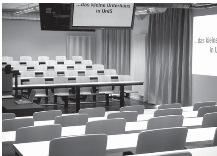
Das britische Unterhaus diente als Vorbild für die Einrichtung des speziellen Seminarzimmers A-126.